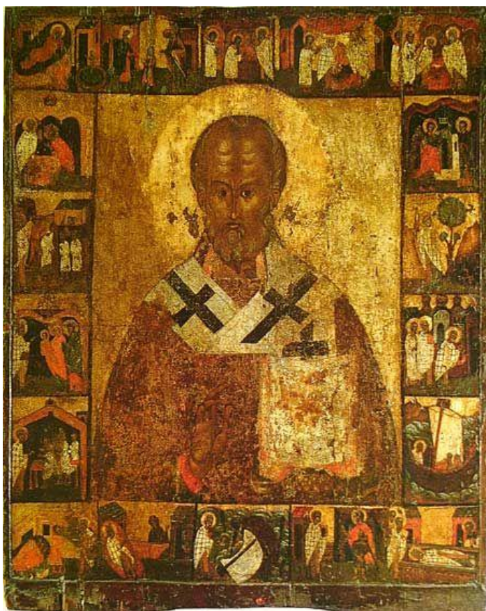
Псковская икона «Никола с житием». Из села Мелётово. Вт.пол. XVI в. ГТГ.

Иосиф, приобрели особую известность в период иконоборчества. В связи с этими событиями церковной истории оказалась творческая судьба преподобного, о чем повествует церковное предание в одном из эпизодов «Жития святителя Николая Чудотворца» (XII в.), который мы приводим полностью.