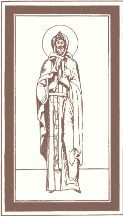
Св. князь Александр Невский, во иноцех Алексий. Лицевой иконописный Подлинник. XVII в.

Так святой изображен на некоторых сохранившихся иконах, шитых покрывах и в Лицевых святцах. Впрочем, существуют и другие примеры, когда святой князь предстает в княжеской одежде, в облике князя-воина. Таким мы его видим на стеновых росписях столпов Благовещенского (1508) и Архангельского (1652-1656) соборов Московского кремля, на книжных миниатюрах Московского летописного свода середины XVI века. Следование той или иной традиции зависело от того, какие задачи ставил перед собой иконописец: изобразить ли князя Александра как родоначальника московских государей, как князя-защитника русской земли, или как