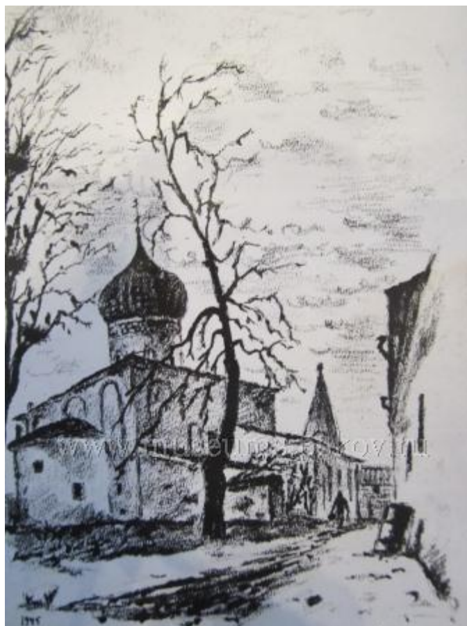
Псков. Церковь Николая "с каменной оградой" XV века . Фотооткрытка 1946 с рисунка О.К. Аршакуни 1945.

следующее экспертное заключение на издание рисунков О.К. Аршакуни «Псков освобожденный». «Рисунки г. Пскова, исполненные художником О.К. Аршакуни, как по своей технике и графическому приему, так и по своей тематике отличаются большим мастерством, вполне подходящим для издания их в виде открыток, каковое издание предусматривается постановлением Псковского облисполкома от 1|VI с.г. для задач популяризации памятников архитектуры»(3). И 20 рисунков О.К. Аршакуни памятников Пскова в виде открыток были изданы огромным тиражом - 10 тысяч каждого вида. Сейчас эти открытки - библиографическая редкость.