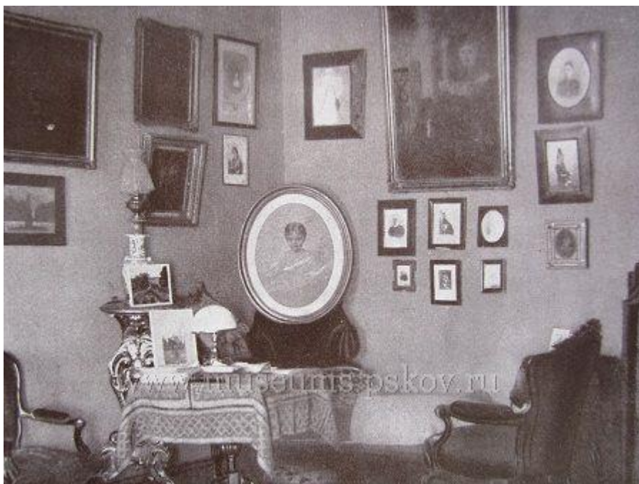
Гостинная А.П. Философовой (1912).