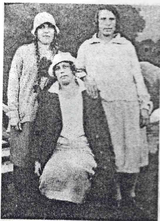
Наталья Михайловна, Галина Владимировна и неизвестная женщина (1930-е гг.).

Это здание сохранилось до наших дней. Было построено одним из первых в послевоенное время по проекту архитектора Э.П. Штольцер 36 . В 1959 году, после объединения Октябрьской улицы и Пролетарского бульвара, изменился и адрес Крестовских: Октябрьский проспект д. 33, кв. 26 37 .