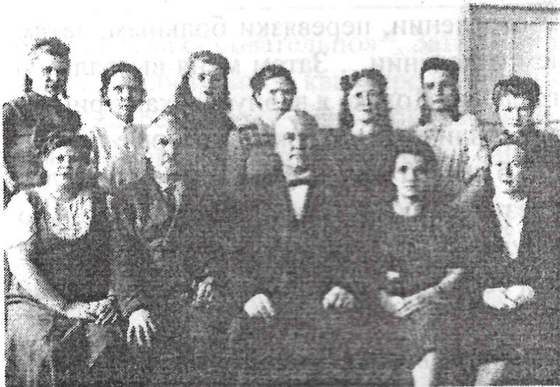
Групповое фото, в Башкирии, 1942–1946 гг.

а в августе 1942 года – в Башкирию, где работал главным врачом и заведующим хирургическим отделением 2-й больницы Сталинского района города Уфы (Черниковск), обслуживающей крупный оборонный завод.