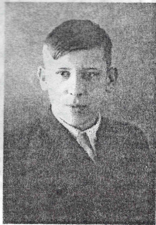
Всеволод (1940-е гг.).

В 1946 году Крестовский возвращается из эвакуации в Ленинград и назначается главным врачом и заведующим стационаром городского онкологического диспансера.