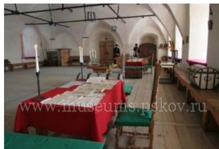
Приказная палата. Внешний вид.