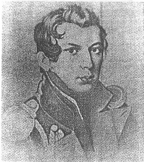
Петр Петрович Коновницын. С портрета К.Гампельна. 1820 г.