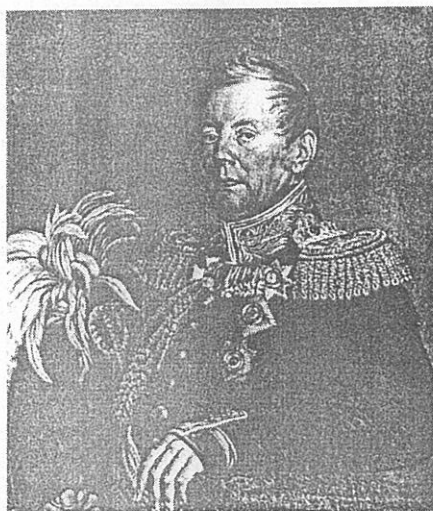
Портреты Анны Ивановны и Петра Петровича Коновницыных, воспроизведенные в Издании Великого Князя Николая Михайловича «Русские портреты XVIII и XIX столетий», I т., 4 вып. - Спб., 1903, стр. 125-126.