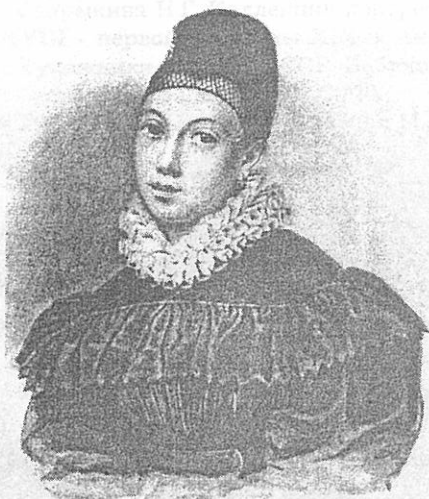
Портрет Елизаветы Петровны Нарышкиной (урожденной Коновницыной). Около 1832 г. Бумага, акварель. 24x19,5 см. Государственный Эрмитаж (Санкт-Петербург).