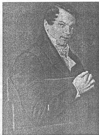
М.М.Нарышкин Акварель Николая Бестужева. Петровский завод, лето 1832 г. Литературный музей, Москва.