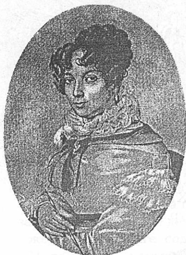
Гравированный портрет Е.П. Нарышкиной (урожденной Коновницыной), воспроизведенный в кн. Бригиты Иосифовой «Декабристы». Пер. с болгарского. - М., Прогресс, 1983.