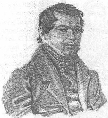
М.М.Нарышкин Акварель Николая Бестужева. Петровский завод, декабрь 1832 - январь 1833 г. Собрание И.С. Зильберштейна (Москва).