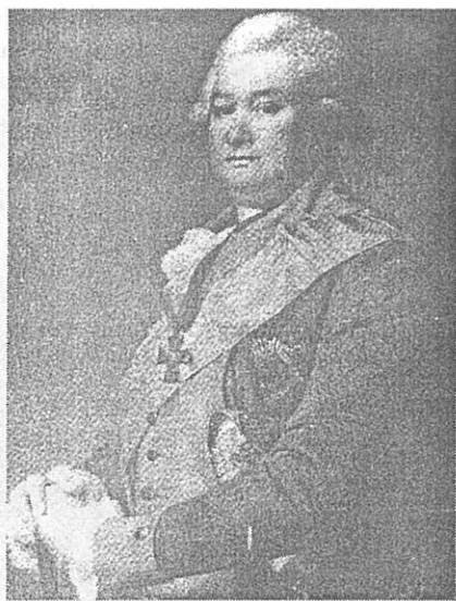
Левицкий Д.Г. (?) Портрет Петра Петровича Коновницына. Конец 1780-1790-ые г. Холст, масло. 84,5x62 см. Киевский музей рус- ского искусства.