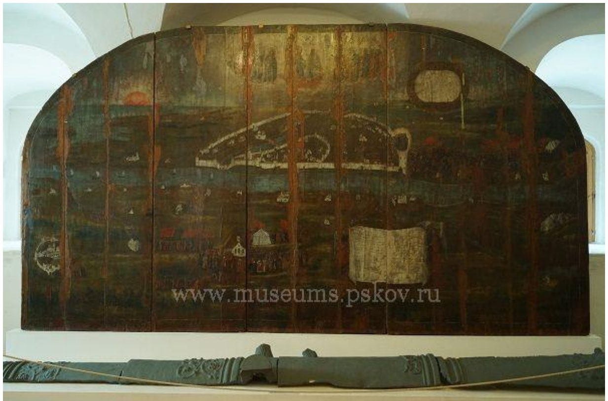
«Сретение Богородицы», икона из часовни Владычного креста.

Композиция печерского извода совершенствовалась одновременно с совершенствованием «географических чертежей» города, планов. Самая поздняя икона на сюжет Сказания о видении Дорофея, - «Сретение Богородицы» 1784 года представляет огромную (около 8 м. кв.) панораму Пскова и его окрестностей. Благодаря сложной реставрации этого памятника, выполненной в 1999 - 2003 годах в отделе реставрации Псковского музея-заповедника живопись освобождена от поздних грубых наслоений, записей и потемневшей олифы, искажавших очертания изображений и колорит иконы. Изображения многих архитектурных объектов приобрели первоначальный вид, некоторые, ранее совсем скрытые записями, выявлены. На этой иконе кроме изображения чудесных событий явления Пресвятой Богородицы, города и окрестностей, мы видим очень подробное изображение непосредственно осады Пскова, а также последующих событий Крестного хода, который был утвержден в 1601 году в память о героической обороне 1581 года, на пути которого и была поставлена часовня Владычного Креста.