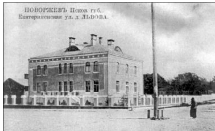
Дом Львовых в Новоржеве.