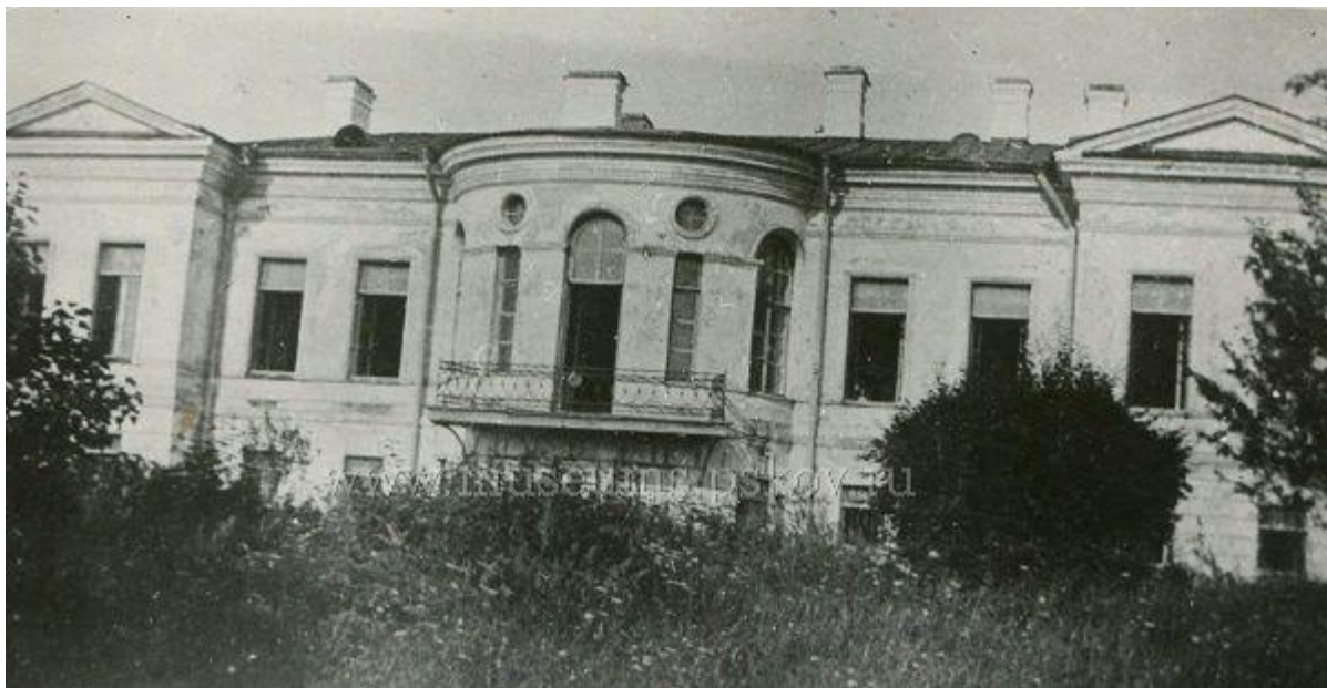
Усадебный дом Скобельцыных