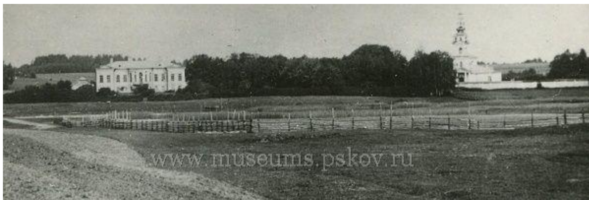
Общий вид усадебного дома и церкви Преображения Господня