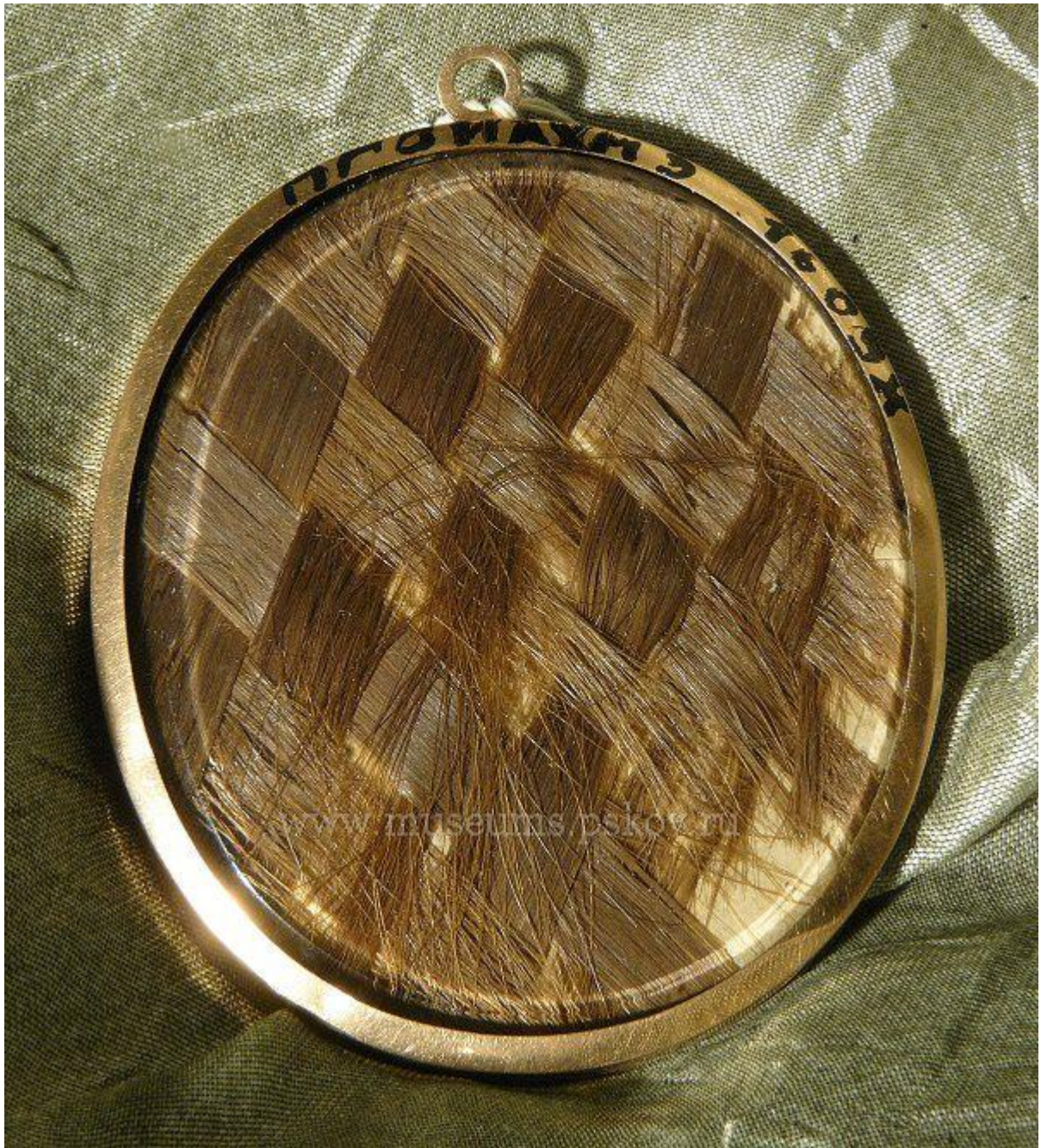
Обратная сторона портрета